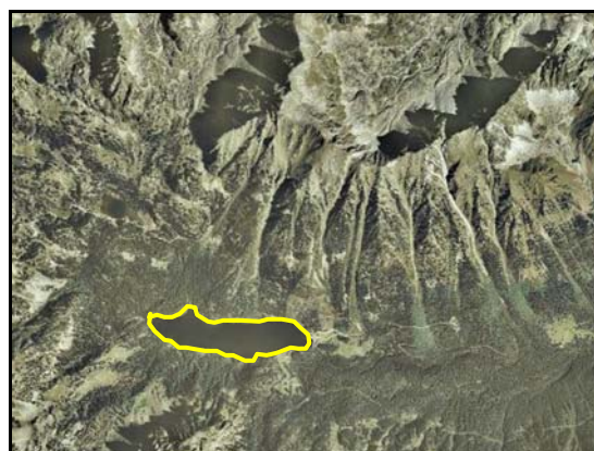
Ejemplos de Laguna .